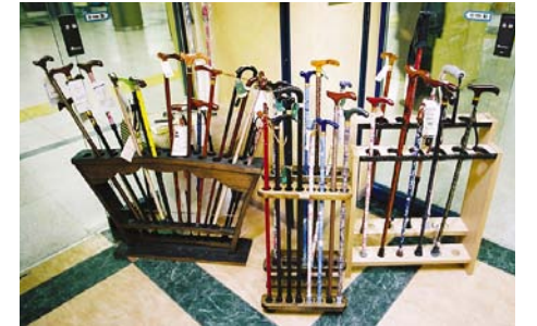
2004年らくらくフェアでの展示